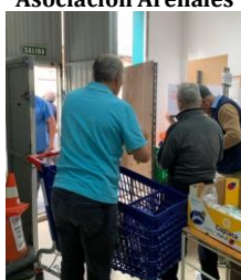
Voluntariado en la Asociación Arenales