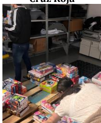
Voluntariado en Cruz Roja